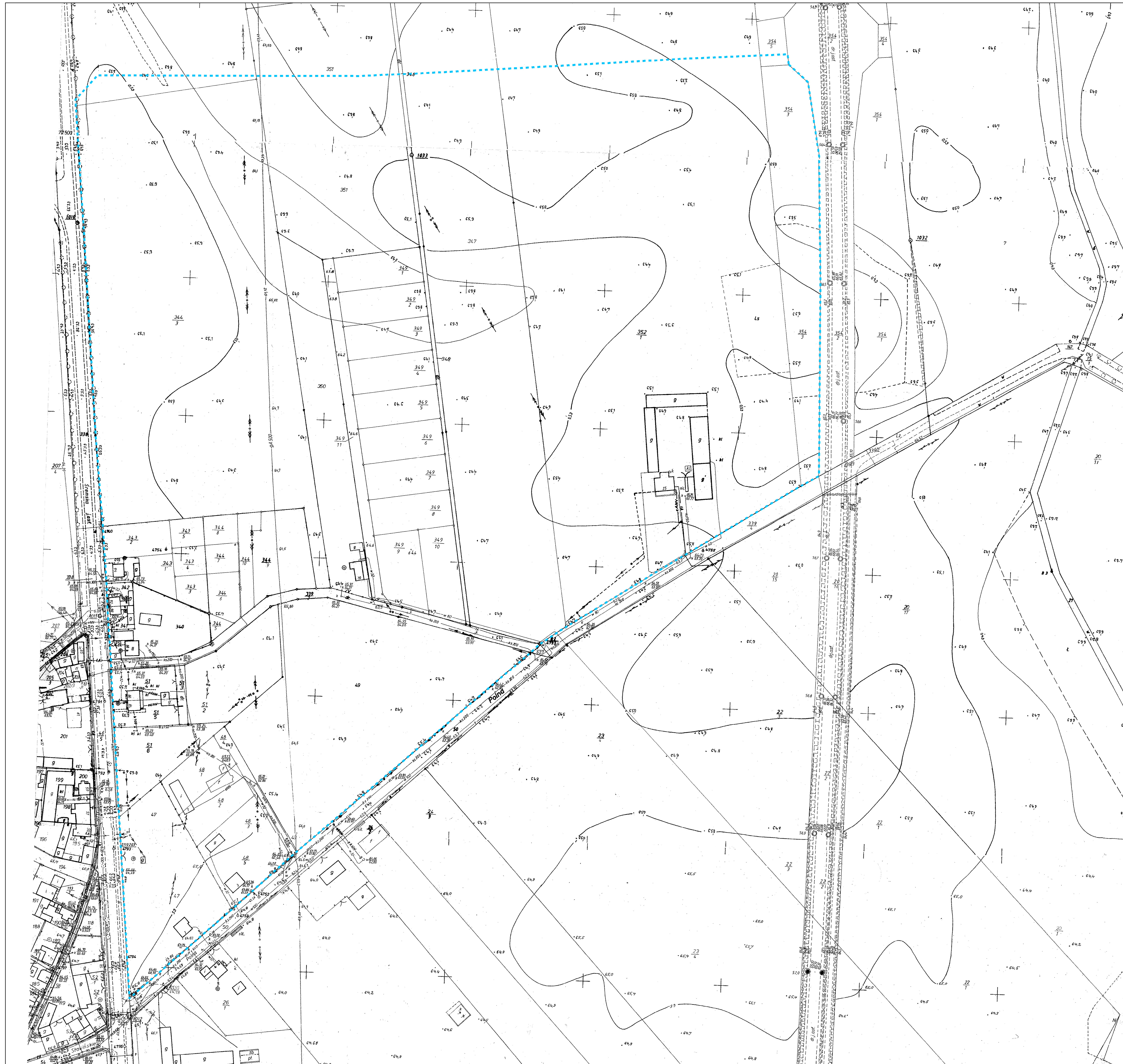
Wrys ze Studium Uwarunkowań i Kierunków Zagospodarowania Przestrzennego Gminy Śrem skala 1:10 000