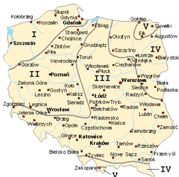
Rys. 1. Podział terytorium Polski na strefy klimatyczne. Na podst. PN-EN 12831

Klimat regionu charakteryzuje się na tle całego kraju łagodnością - stosunkowo małą roczną amplitudą temperatury powietrza, wczesną wiosną, długim latem, krótką zimą. Temperatura średnia w styczniu wynosi -1,5^{\circ}\text{C} , w lipcu 18^{\circ}\text{C} , a średnia roczna temperatura powietrza ok. 8^{\circ}\text{C} . Są to więc relatywnie – w skali Polski – b. korzystne warunki dla osadnictwa ludzi i dla gospodarowania energią. Wyraża to m. in. wskaźnik tzw. stopniodni grzewczych (HDD) – proporcjonalny do zapotrzebowania na energię do ogrzania pomieszczeń. Region poznański ma HDD na poziomie 88,7 % wartości dla regionu stołecznego.