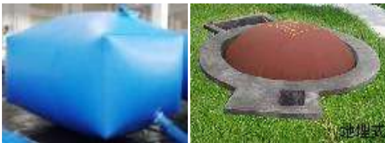
Zbiorniki gazu w przydomowych biogazowniach

Innym przykładem instalacji dla podobnego celu ale do zastosowania na większych działkach lub w gospodarstwach rolnych są przydomowe biogazownie (instalacje mniej skomplikowane niż typowe biogazownie rolnicze, wdrażane w Polsce wciąż z kłopotami). Są to proste urządzenia służące do produkcji biogazu na potrzeby gospodarstw domowych. Biogazownia składa się z komory fermentacyjnej i zbiornika gazu. Komory fermentacyjne mogą być wykonane z kręgów betonowych lub rur PCV (np. o średnicy 1,0 m) osadzonych w dnie betonowym. Zbiornik gazu powinien charakteryzować się szczelnością i odpornością na działanie kwasów. Na rynku dostępne są zbiorniki wykonane ze specjalnej folii. Dostępne są też kompaktowe biogazownie składające się ze zbiornika fermentacyjnego z PVC o pojemność 100 litrów i zbiornika gazu o pojemności 80 litrów wykonanego ze stali nierdzewnej. Surowcem do produkcji biogazu są wszystkie organiczne odpady powstające w gospodarstwie lub na działce. Biogaz można wykorzystać na wiele różnych sposobów i z tego powodu jest on cennym produktem. Ze 100 kg. suchej trawy w ciągu miesiąca można wyprodukować 35-40 m 3 biogazu co starczy np. do przygotowania trzech posiłków dla 3 -osobowej rodziny w ciągu miesiąca.