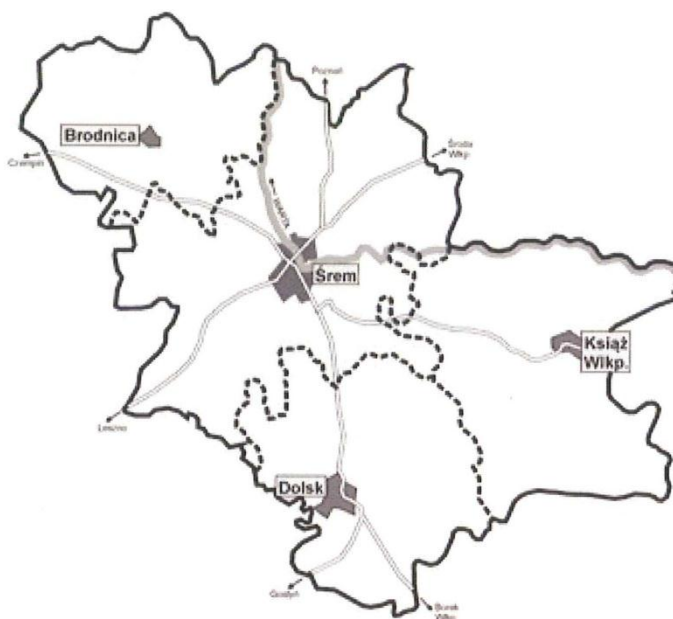
Mapa 1. Powiat Śremski