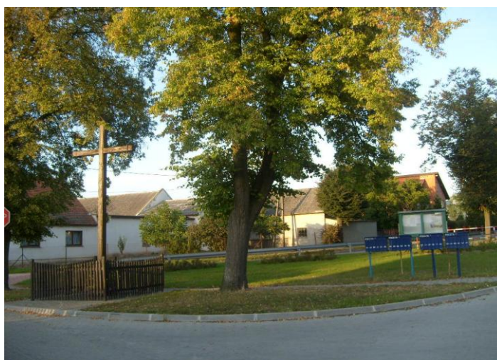
Rysunek 3. Wygląd wsi Bodzyniewo (2)