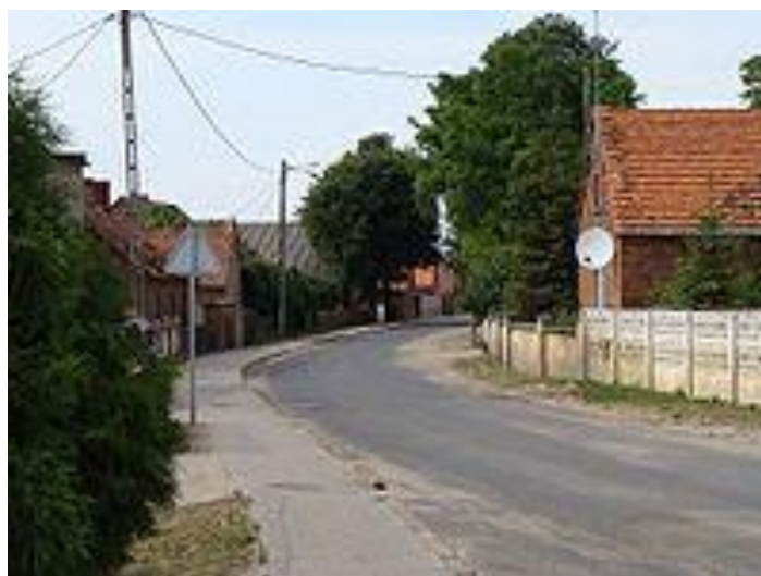
Rysunek 2. Wygląd wsi Bodzyniewo (1)