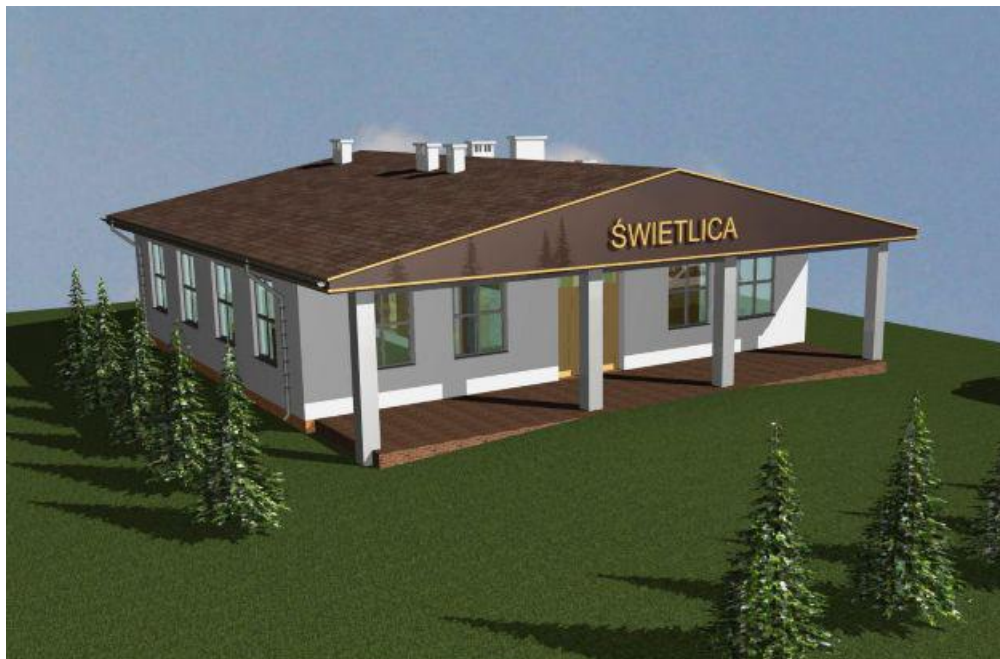
Rysunek 5. Projektowana świetlica wiejska w Bodzyniewie