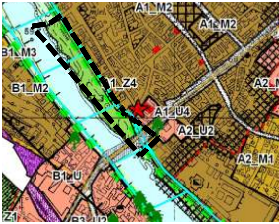
GRANICA OBSZARU OBJĘTEGO PLANEM MIEJSCOWYM