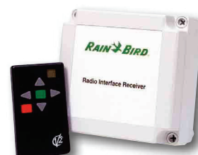
99-kanalowy radiowy przekaźnik zdalnego sterowania oraz odbiornik