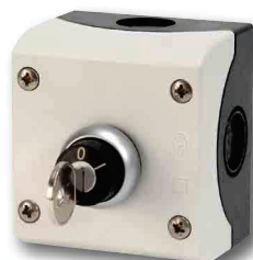
Włącznik na kluczyk do sterownika Dialog +: pozwala na ręczne uruchamianie cyklu bez bezpośredniego dostępu do sterownika.