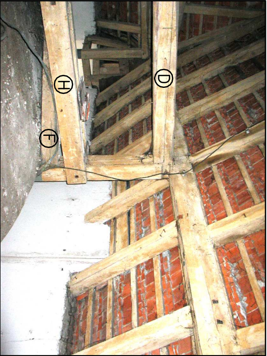
POŁĄCZENIE DOLNEGO BELKOWANIA ZE SŁUPEM CENTRALNĄ ŚCIANY STOLCOWEJ – FOT. STAN ISTNIEJĄCY