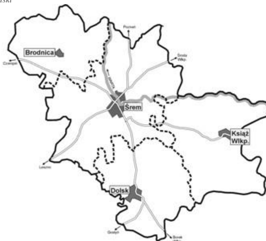
Mapa 1. Powiat Śremski